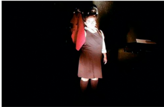
LA OBRA “EL TORO” ABORDA LAS CONSECUENCIAS DEL CYBERBULLYING.

A esto se le suma que el concepto “bullying” viene de “bull”, una palabra en inglés que en su